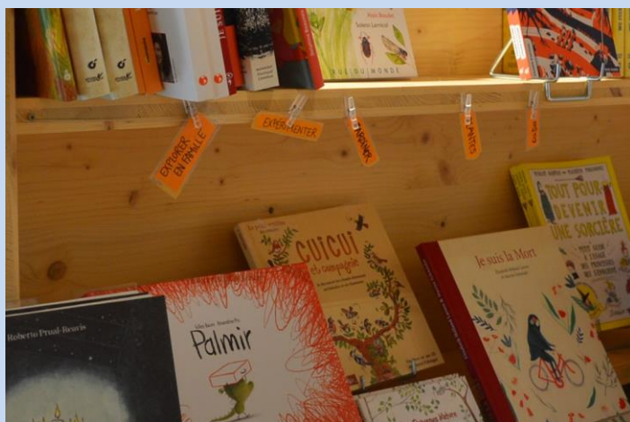
Venez découvrir la Petite Librairie et offrir des livres ! L'occasion d'une balade au Viel Audon...